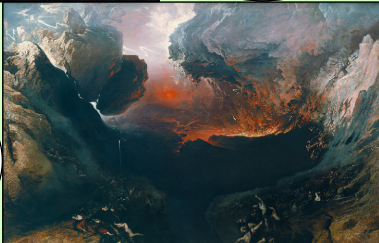
John Martin, The Great Day of His Wrath , 1851-3