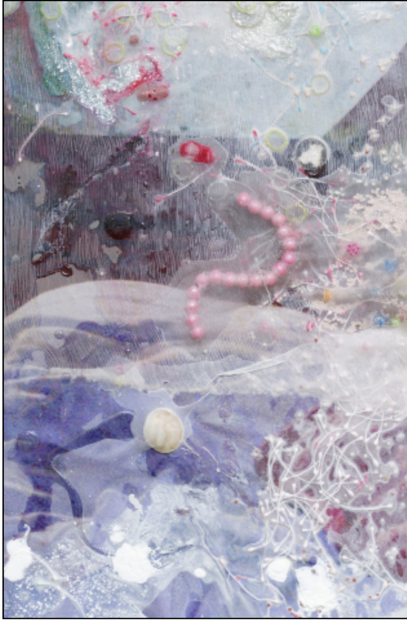
Mimosa Echard, Numbs , 2021