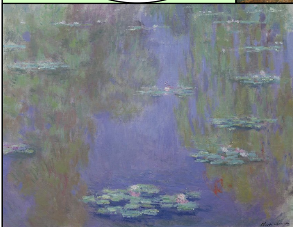
Claude Monet, Nymphéas , 1903