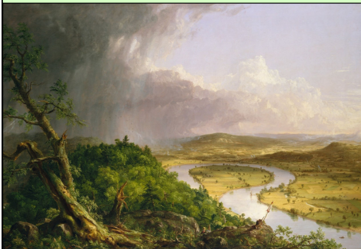
Thomas Cole, The Oxbow (The Connecticut River Near Northampton) , 1835-1836